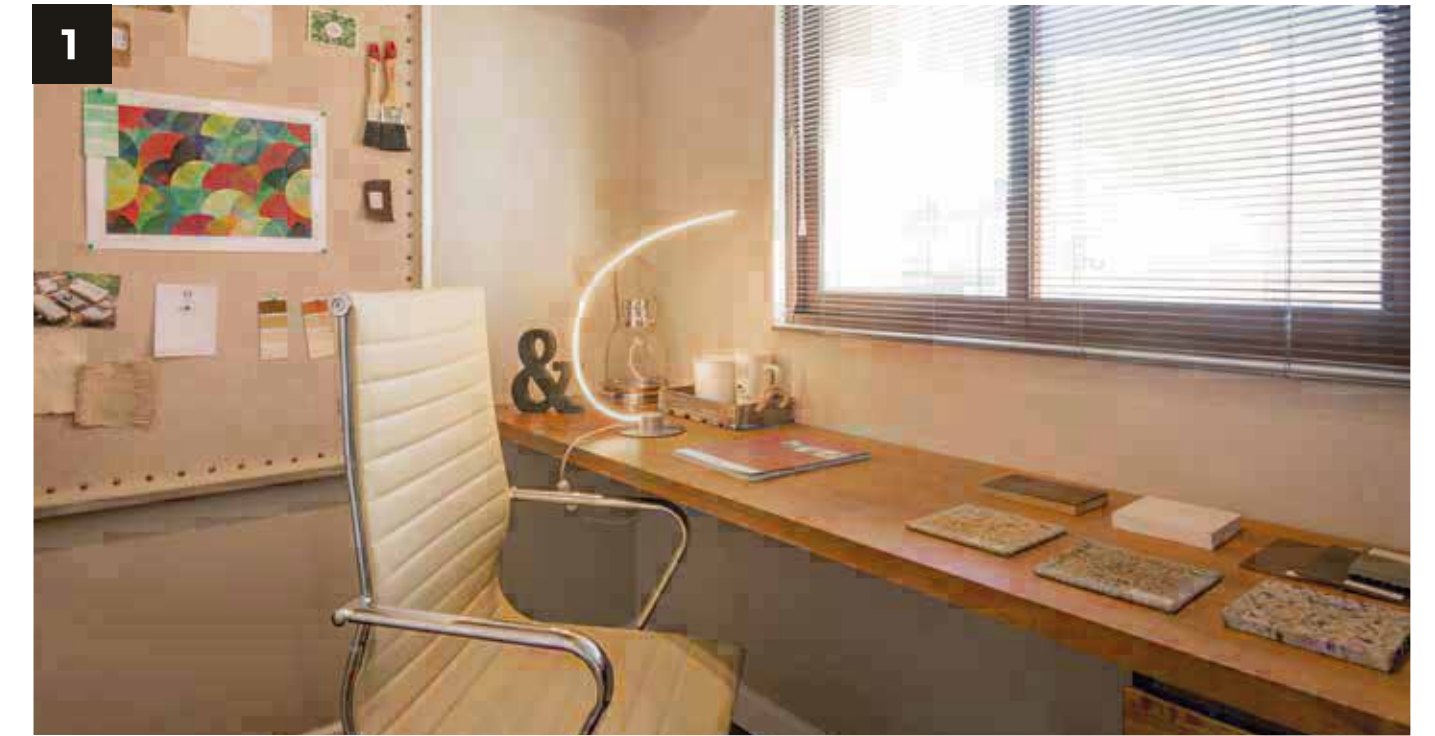
1. Sala de estar con escritorio