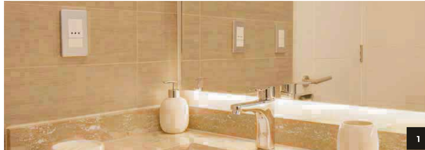
1. Baño con cubierta de mármol y cinta de iluminación led debajo del espejo