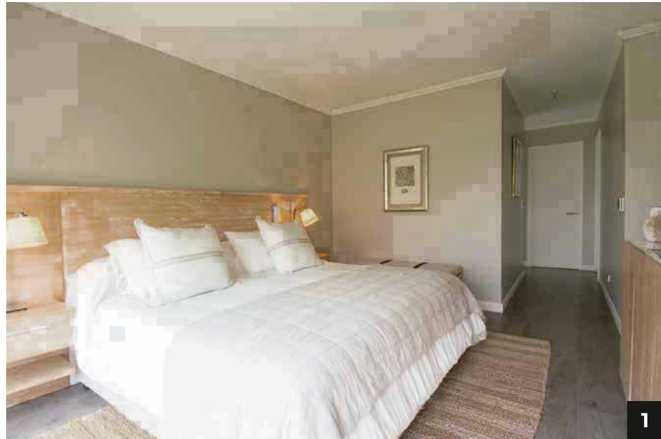
1. Dormitorio principal en suite con ventana termopanel