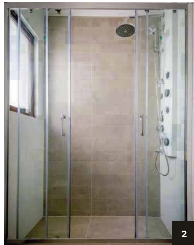
2. Baño principal con ducha en obra, mampara de vidrio y columna de hidromasaje