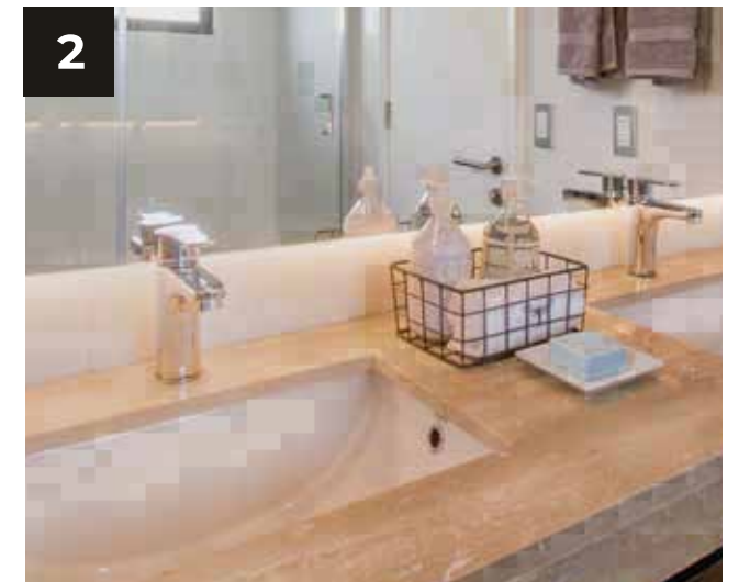
2. Baño principal con doble vanitorio