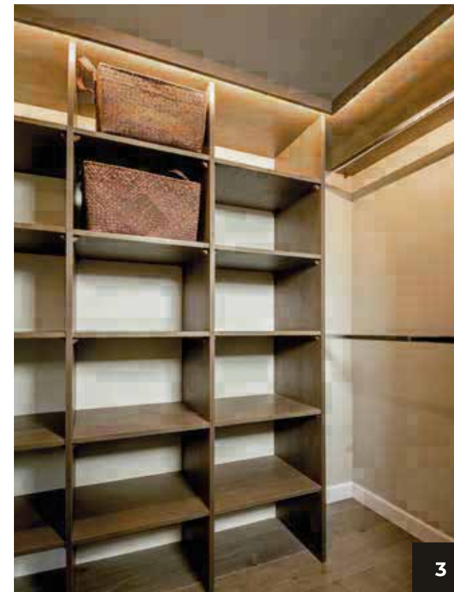
3. Amplio walk in closet y cinta de iluminación led