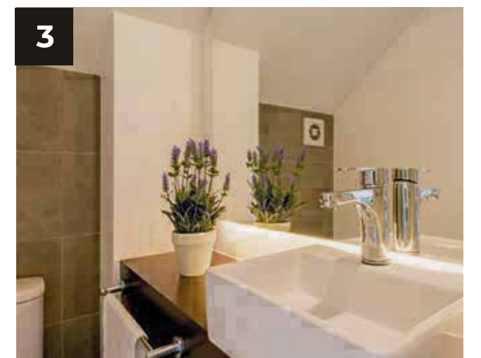
3. Baño de visitas con detalles en diseño