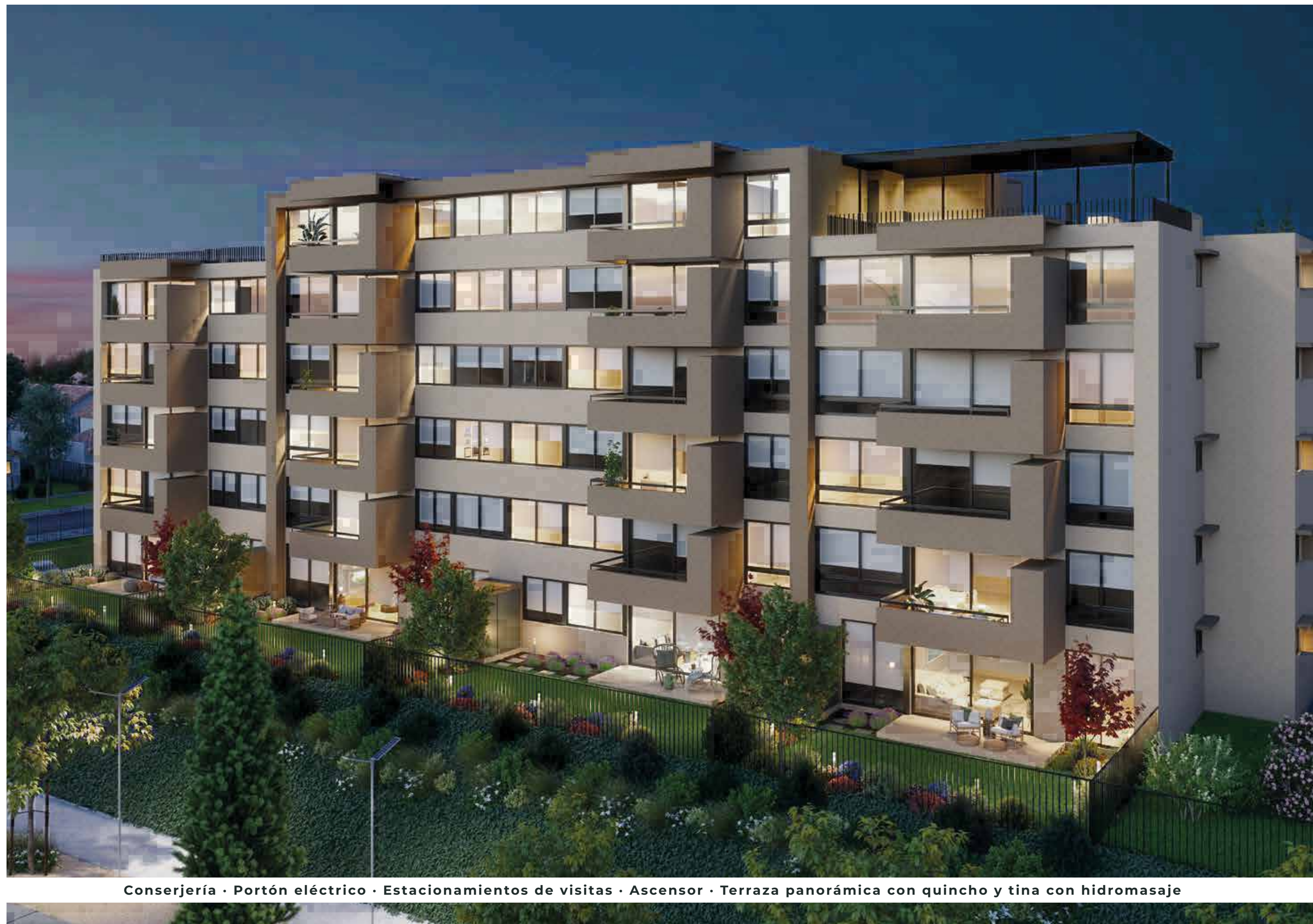
Conserjería • Portón eléctrico • Estacionamientos de visitas • Ascensor • Terraza panorámica con quincho y tina con hidromasaje

Todo pensado en las comodidades de vivir en un edificio de vanguardia y al más alto nivel, porque tú y tu familia lo merecen.